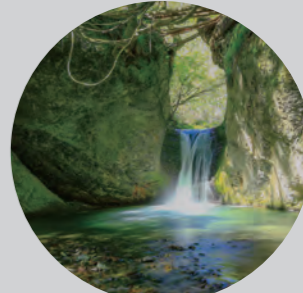
矢祭町 吉野平の不動滝

RAMEN CAFE & SWEETS FOOD HISTORY KOMAINU NATURE EVENT EXPERIENCE GOLF OMIYAGE