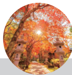
棚倉町 山本不動尊